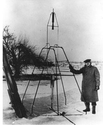
Goddard y uno de sus cohetes de combustible líquido

Un ejemplo más de la incomprensión de los principios de la física. El principio de acción y reacción. A principios del siglo XX, solo un puñado de esforzados visionarios se tomaban en serio la astronáutica. Uno de ellos era Robert H. Goddard, que realizó, en solitario, muchos experimentos desarrollando las bases de los motores de combustible líquido. Solo obtuvo la más absoluta de las incomprensiones y críticas basadas, en algunos casos, en un claro desconocimiento de la física.